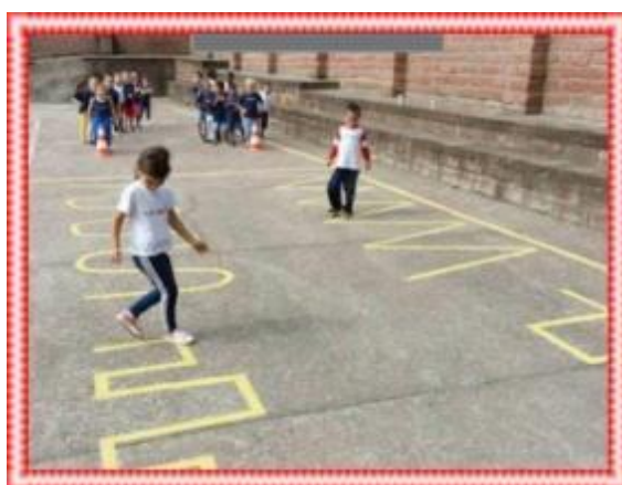
Imagem da atividade